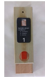
Balise à trouver