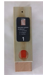
Balise à trouver